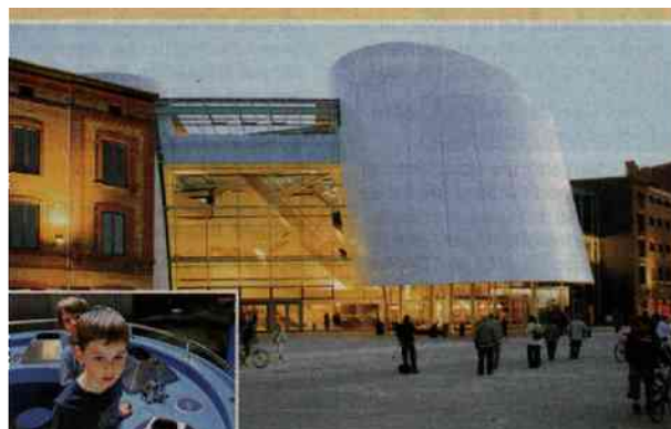
STRALSUND »Meer für Kinder«. Das Ozeaneum in der Hansestadt ist ein Museum der Superlative. Rund 7000 Fische und Meerestiere werden unter nahezu natürlichen Bedingungen gezeigt. Im Dachgeschoss des futuristischen Baus bringen 320 Quadratmeter Ausstellungsfläche Kinder zum Staunen. Mit interaktiven Lern- und Spielelementen (l.) tauchen sie ein in faszinierende Wasserwelten.

Zeugnisse der Geschichte bewahren, Kunst und Kultur fördern. Diesem Anliegen hat sich die Ostdeutsche Sparkassenstiftung gemeinsam mit den Sparkassen verschrieben und dabei viel bewegt. Seit 1996 wurden in Mecklenburg-Vorpommern, Sachsen, Sachsen-Anhalt und Brandenburg 1345 Projekte mit rund 43 Millionen Euro unterstützt